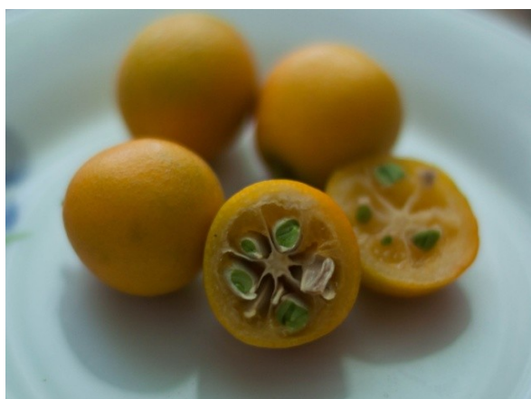
Рис. 1. Малайский кумкват